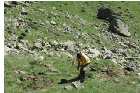
Travail à la houe