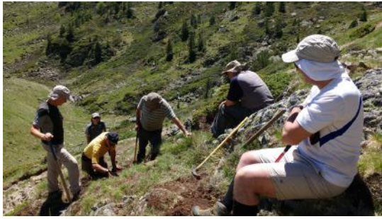
Prise de décision