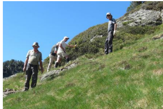
Travail à la pioche dans la caillasse. Dur, dur,...