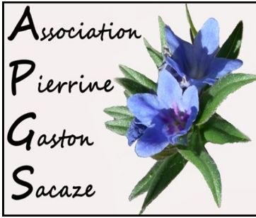
Association Pierrine Gaston-Sacaze