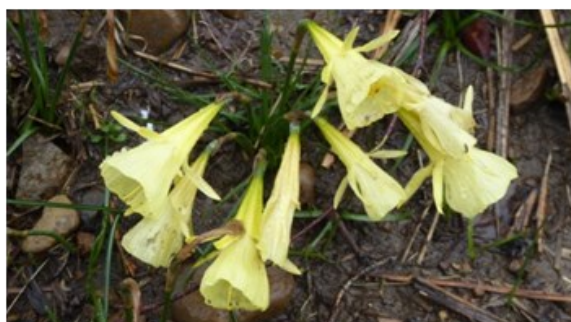
« Trompette de méduse » Narcissus gigas

Ci-après, la liste des plantes observées durant cette belle matinée !