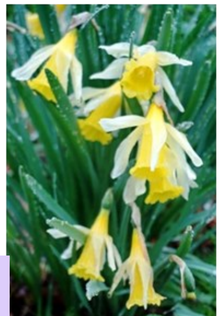
« Jonquille » Narcissus pseudonarcissus subsp. pseudonarcissus L.