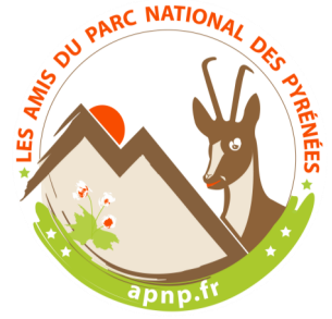
Association des Amis du Parc National des Pyrénées