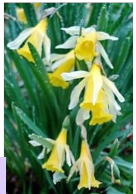
« Jonquille » Narcissus pseudonarcissus subsp. pseudonarcissus L.