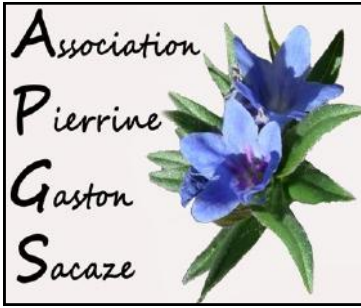
Association Pierrine Gaston-Sacaze