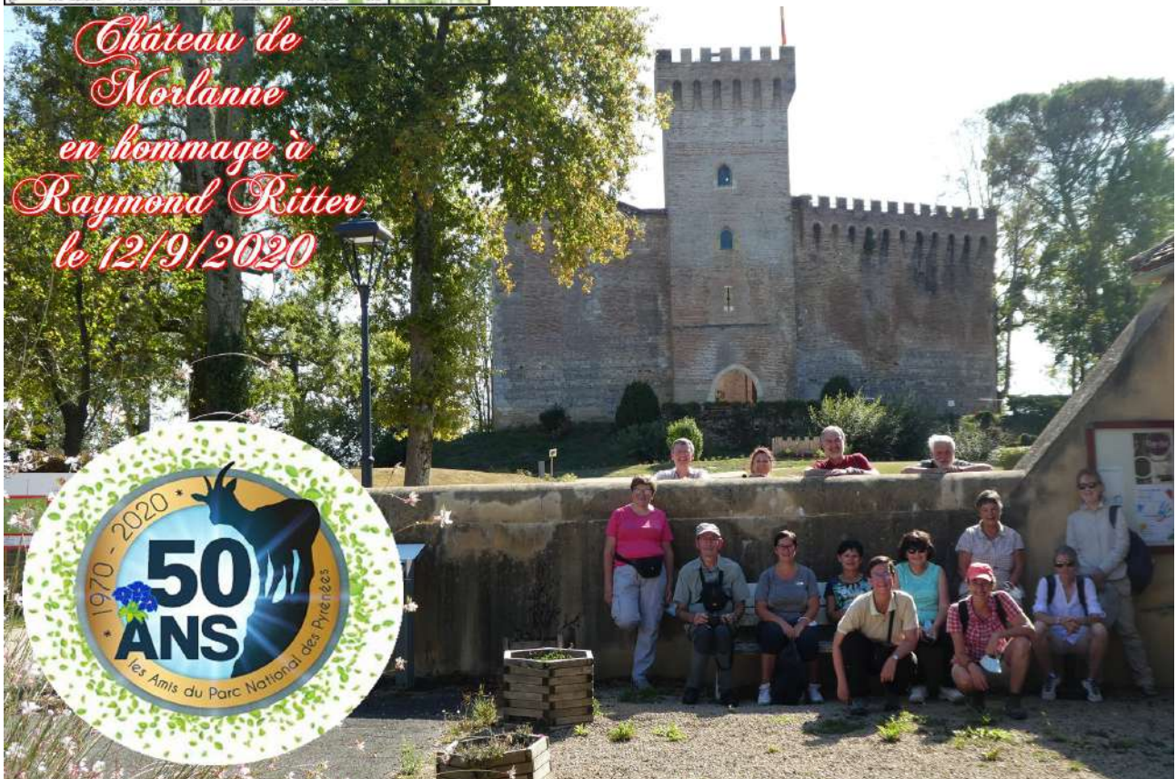
Les deux groupes réunis pour la photo-souvenir

Après la petite balade d'environ 5km permettant de découvrir l'environnement, les participants ont été partagés en deux groupes pour répondre au protocole sanitaire et, après tirage au sort, ont suivi l'un des deux programmes : visite du village, déjeuner, visite du château ou inversement. Les guides du château et du village, les responsables des restaurants qui nous ont reçus, tout le monde a été aimable et compétent. Ceux qui ne connaissaient pas trop Raymond Ritter auront appris beaucoup le concernant. L'Office de Tourisme du nord Béarn, le village de Morlanne, savent combien les APNP restent redevables à Raymond Ritter et nous leur en sommes reconnaissants.